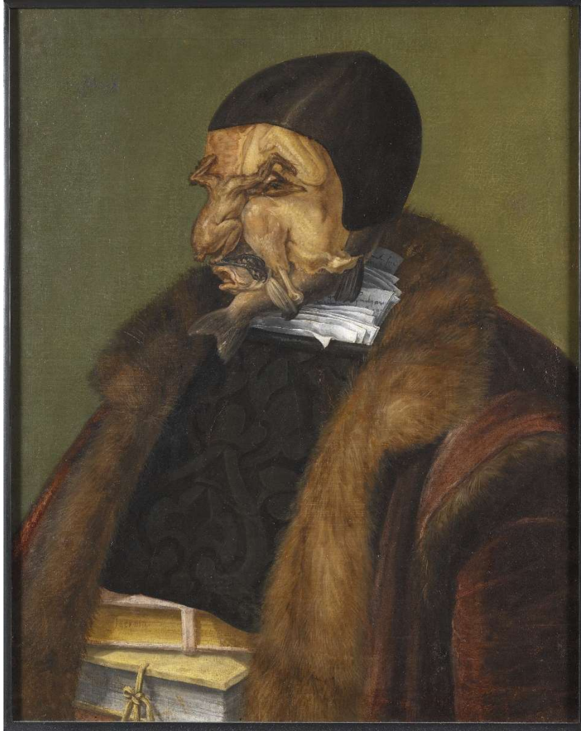
Figure 3 : G. Arcimboldo, Le juriste , huile sur toile, 1566 (Stockholm, Nationalmuseum)

professeurs de droit ( Doctorum agnomina ) pour transformer une ronde de docteurs en un bestiaire académique amusant, ici Arcimboldo épingle un des défauts les plus saillants de la profession juridique : le fait d'avaler les livres plutôt que de les digérer.