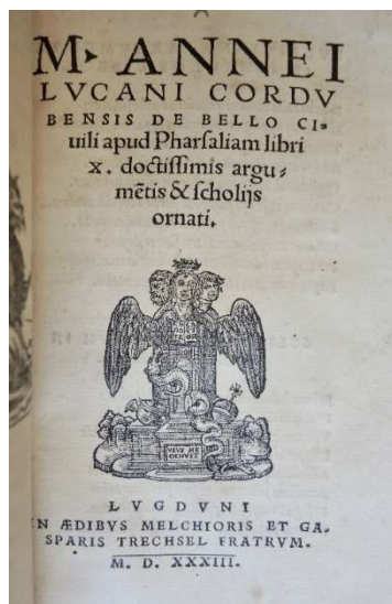
Figure 1 : M. Annei Lucani Cordubensis de bello civili apud Pharsaliam libri X. doctissimis argumentis et scholiis ornati , Lyon, Melchior et Gaspard Trechsel, 1533 (Genève, BGE, Hd 243 rés. = Cth 3258)

Dans La fabrique Calvin , j'ai comparé les quatre livres annotés par lui et ses amanuenses que j'ai découverts avec trois livres annotés déjà connus, dont la Pharsale de Lucain 15 . Dans cet ouvrage-ci, la première annotation de Calvin est une biffure sur Vox , au livre premier. Pharsalia est le lieu où César a battu Pompée, et Lucain a construit une longue épopée en dix livres sur les débuts de la guerre civile romaine en lui donnant le nom de la victoire de César. Les vers 270-271 du livre I portent « Vox quondam populi, libertatemque tueri/ Ausus, et armatos plebi miscere potentes » 16 . Calvin a lu très attentivement le passage du Rubicon par César, en soulignant la réaction du Sénat et du tribun Curion : « [Curion] jadis la voix du peuple, hardi à défendre la liberté et à confondre avec la plèbe les puissants en armes » 17 .