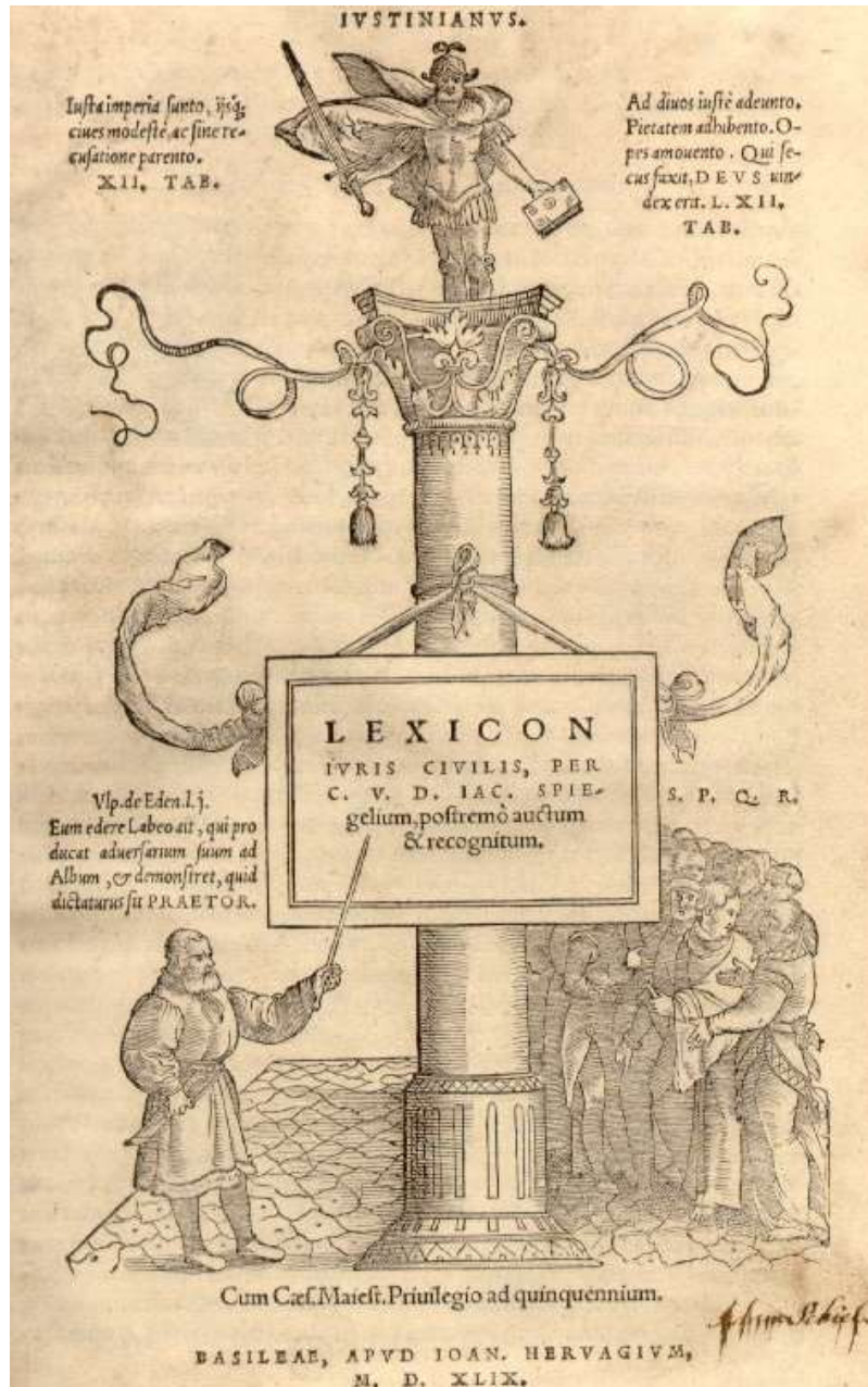
Figure 2 : J. Spiegel, Lexicon iuris civilis , Bâle, chez Ioannes Hervagius, 1549 (université de Bielefeld, http://ds.ub.uni-bielefeld.de/viewer/image/2006045/1/LOG_0000/ )