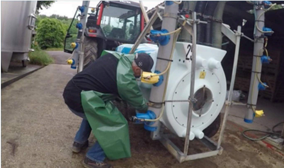
Figura 5 : Ilustración de las vicisitudes de un diseño tecnocéntrico que no tiene en cuenta el uso. Sistema de apertura del circuito de agua ubicado en la parte trasera del pulverizador remolcado, que lleva al viticultor a contorsionarse y a entrar en contacto con las partes contaminadas del equipo

capacidad (en términos de volumen, agitación, enjuague, pulverización, recuperación, estanqueidad) y a los avances tecnológicos (nuevas boquillas de pulverización, nueva sonda, nuevo sistema de enjuague). Sufren en sus propias carnes las regulaciones y las lógicas de diseño tecnocéntricas que deben implementar en la práctica. Este contexto limita a los agricultores y los obliga a realizar compromisos entre la salud de la viña, la salud humana y la salud ambiental, y a menudo a tener que hacer malabarismos entre el bienestar físico, mental y social.