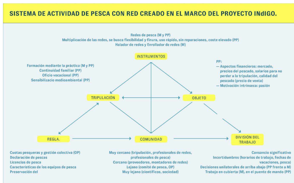
Figura 4 : Sistema de actividad de pesca con red creado en el marco del proyecto INDIGO