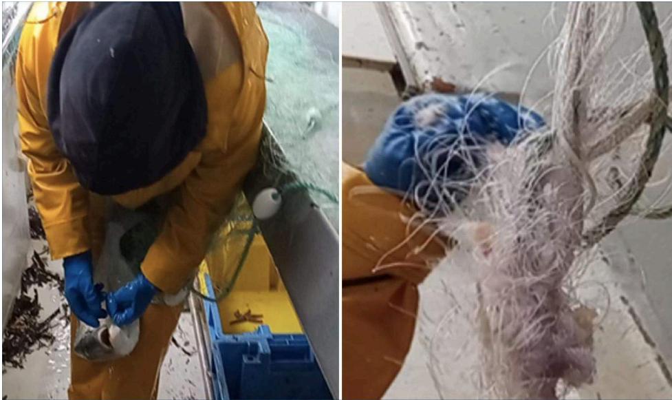
Figura 6 : Actividad de desenmallado a bordo de un pez enredado en la red (foto de la izquierda), una tarea que exige a los marineros un equilibrio entre rapidez y preservación de la calidad de la captura (valor económico del pescado desenmallado), la red (evitar romper las mallas) y su propia salud (esfuerzo de las extremidades superiores en un espacio reducido, acciones repetitivas). Desenmallado de trozos de peces despedazados atascados en las mallas que obliga al marinero a realizar más operaciones