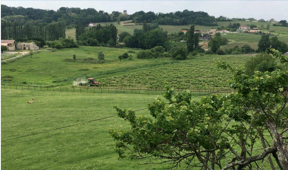
Figura 2 : Aplicación de la mezcla de pulverización con un pulverizador arrastrado por un viticultor de la CAPI. Este tratamiento, filmado desde la casa del viticultor, revela una niebla en la parte trasera de la máquina mientras se desplaza por una hilera de viñas y otras parcelas cercanas dedicadas a animales humanos y no humanos. Fotografía utilizada para cuestionar la protección y exposición de los organismos vivos durante un aloconfrontación entre viticultores asociados y familiares que viven en la finca