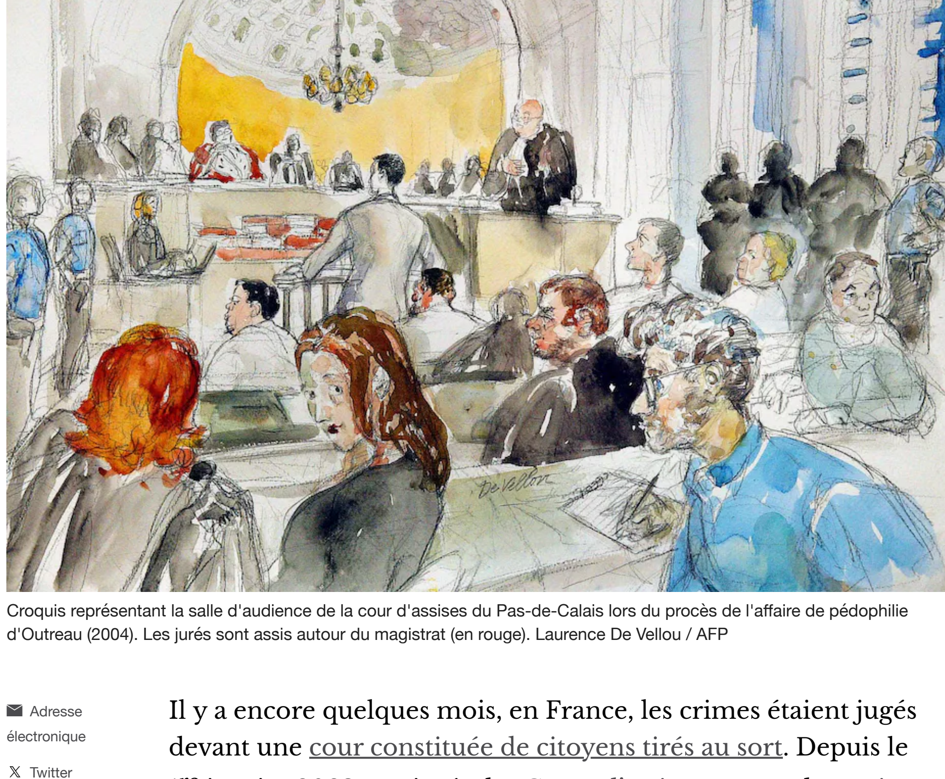
Croquis représentant la salle d'audience de la cour d'assises du Pas-de-Calais lors du procès de l'affaire de pédophilie d'Outreau (2004). Les jurés sont assis autour du magistrat (en rouge). Laurence De Vellou / AFP