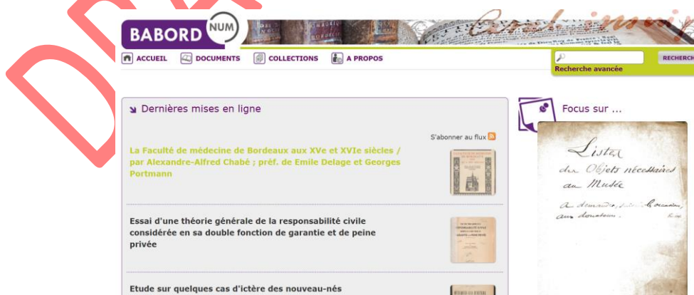
Vue en 2021 du Site web de la bibliothèque patrimoniale numérique du réseau des bibliothèques Universitaires de Bordeaux, BabordNum

La bibliothèque numérique patrimoniale BabordNum 1 est portée par le service de coopération documentaire (Direction de la documentation de l'université de Bordeaux). Ce projet, porté par l'Université de Bordeaux sur le plan opérationnel, est le fruit d'un partenariat étroit entre : l'Université de Bordeaux, l'Université Bordeaux-Montaigne, Sciences-Po Bordeaux, Bordeaux Sciences Agro et Bordeaux-INP. BabordNum propose la consultation et le téléchargement gratuit, sous licence ouverte, des centaines de documents patrimoniaux numérisés. Avec plus de 50.000 visiteurs différents chaque année pour plus de 1,4 millions de vues et téléchargements par an, cet outil numérique est devenu essentiel pour la mise à disposition du patrimoine documentaire auprès des chercheurs et des étudiants. Faisant le lien entre l'héritage historique et la science ouverte, BabordNum est construit et alimenté en partenariat avec la bibliothèque nationale de France et est intégré dans Gallica, en complémentarité avec la base « 1886 » 2 de l'Université Bordeaux Montaigne, elle aussi intégrée dans Gallica.