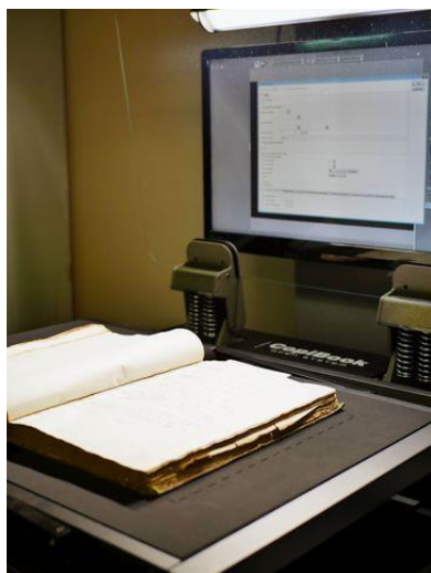
Atelier de numérisation

en mesure de numériser en interne les documents demandés par les chercheurs, avec des équipements et savoir-faire professionnels en interne, permettant de numériser les documents à la demande. Les numérisations de masse, en particulier pour les centaines de thèses anciennes, restent numérisées par des prestataires extérieurs.