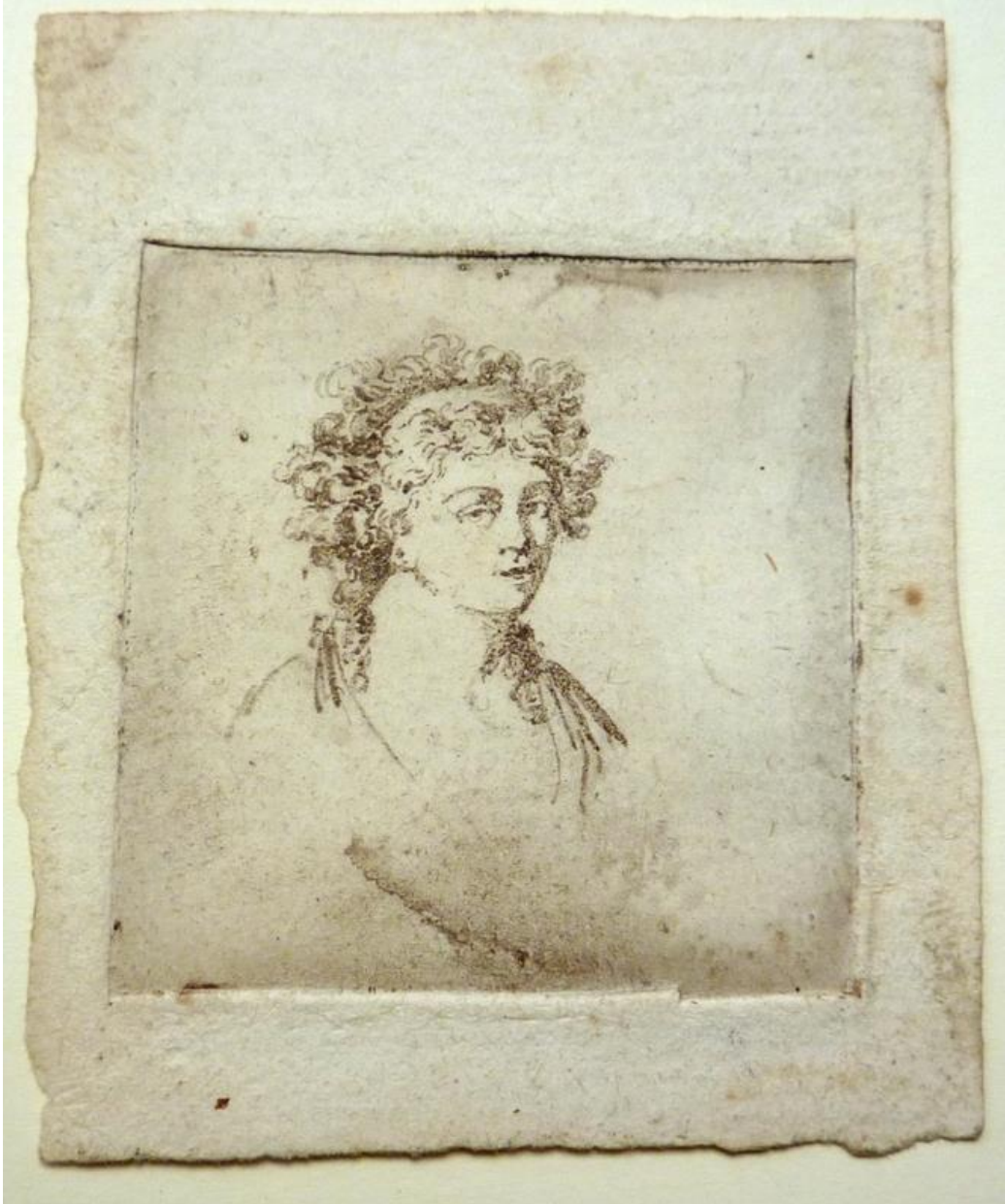
Portrait gravé de Mme Lavoisier, vers 1790, Université de Bordeaux, FR 35309, http://www.babordnum.fr/items/show/1088

bibliothèques et archives publiques. C'est pour les chercheurs un moyen de diffuser rapidement les documents auxquels ils se réfèrent. Ce fut le cas en 2018 par exemple, avec la découverte d'un portrait inédit de M me Lavoisier dans les fonds de la bibliothèque Universitaire de sciences et techniques 4 .