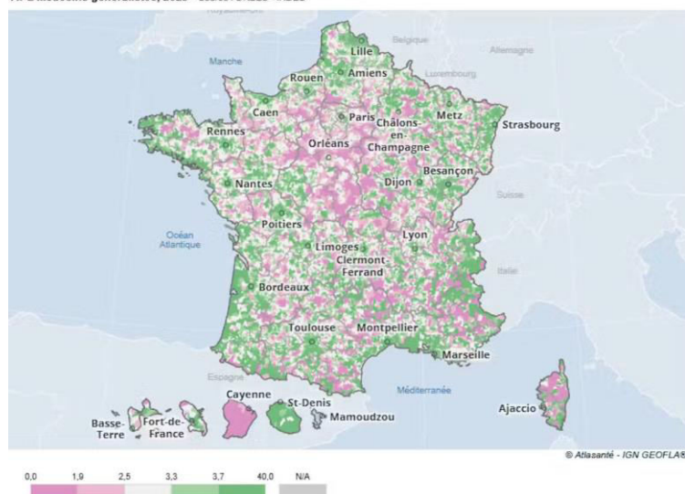
APL Médecins généralistes, 2023

Représentation de l'APL aux médecins généralistes en 2023.